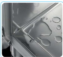
Cantos internos arredondados