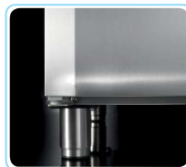
Pés em aço inox ajustáveis em altura (110-190 A mm)