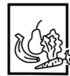
KIT FRUTAS E VEGETAIS